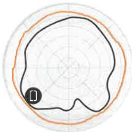
Figure 2 - T310d 2.4GHz Azimuth Antenna Patterns