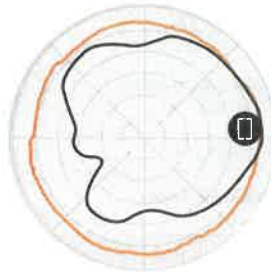
Figure 3 - T310d 5GHz Azimuth Antenna Patterns